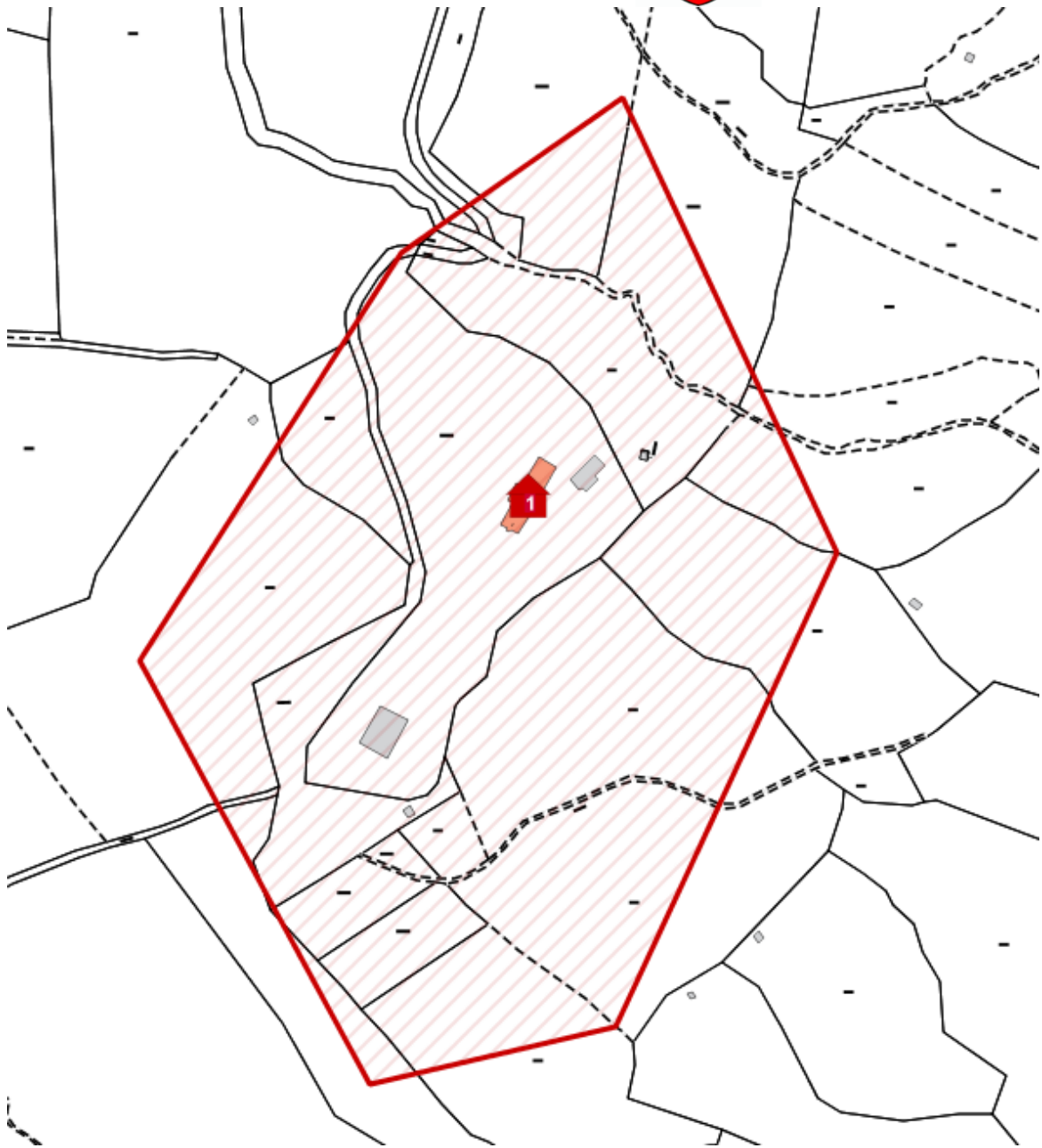
Karte 2: Los1, Bereich Outward Bound